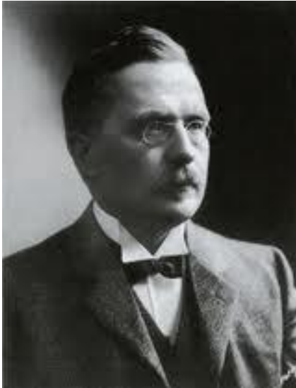
Fridtjuv Berg 1859-1916 "Folkskolan såsom bottenskola"